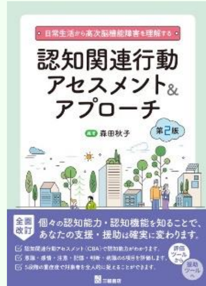
日常生活から高次脳機能障害を理解する 認知関連行動 アセスメント&アプローチ 第2版 三輪書店,2023年,PT1名共同執筆