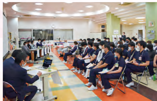
▲現地・ZOOMを合わせて約350名が参加しました。

令和5年11月27日に関東カチグループ17病院の職員を対象にむすびプロジェクト研修会を開催しました。第2回目となった今回は、蒲田リハビリテーション病院を退院された患者様と退院後の支援に関わられた介護支援専門員・自立訓練事業所の理学療法士・訪問リハビリの作業療法士、地域の支援事業所スタッフ5名をお招きし、シンポジウム形式で開催しました。脳卒中を発症後に新規就労を目指している事例を通して、回復期リハビリテーション病院、地域の支援事業所との連携についての経緯や支援内容と今後の支援について、ご講義をいただきました。総勢350名程のグループ病院の職員が現地・Zoomにて集い退院後の地域の支援事業所との連携の大切さに関する知識を深めました。患者様の声を直接聞いたこともとても貴重な機会となりました。今後も患者様へのサービスの質の向上につながるよう研修会を企画していきます。