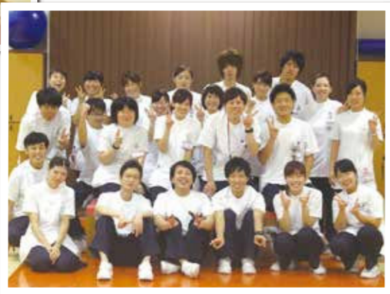
②作業療法士計43名 作業療法士集合写真