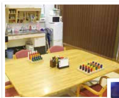
①作業療法室 アクティビティやテーブルを 用いた手のリハビリ、活動 を行っています。