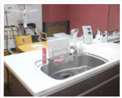
③シュミレーションルーム 自宅環境を想定して、調理や入浴、 家族指導を行います。

赤羽リハビリテーション病院では、朝食前と夕食前にもリハビリテーションを実施しています。実際のご自宅での生活を想定して、ベッドから起き上がることから、更衣・整容・トイレ動作・デイルームまでの移動を重点的に取り組みます。また、シュミレーションルームも配置しており、自宅内動作練習として調理、入浴、退院前の家族指導を行い、自宅退院に際して患者様、御家族様に不安が残らないように活用しています。今後も患者様が生き生きと社会生活を送れるようにスタッフ一同、思いやりを持ち支援を行います。