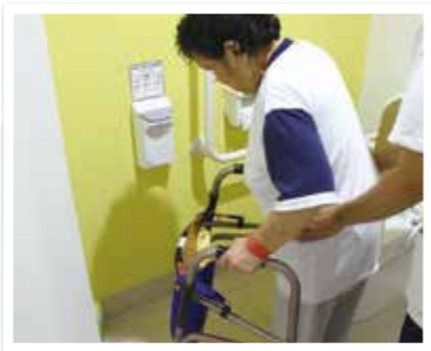
④生活動作中心のリハビリテーション 退院後の生活動作を想定して、起床から 整容動作、トイレ動作を中心に行います。